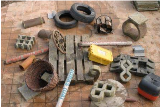
Aufbau eines Trümmerfeldes der LK 1

Das Trümmerfeld hat, in allen Leistungsklassen eine Größe von 4 mal 4 Metern.