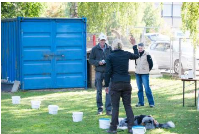
Beispiel Bilder von gleichen Behältnissen (LK 1, bzw.: LK2)

In der LK 3 stehen 10 unterschiedliche Behältnisse in Reihe