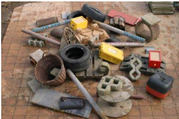
Aufbau eines Trümmerfeldes der LK 2