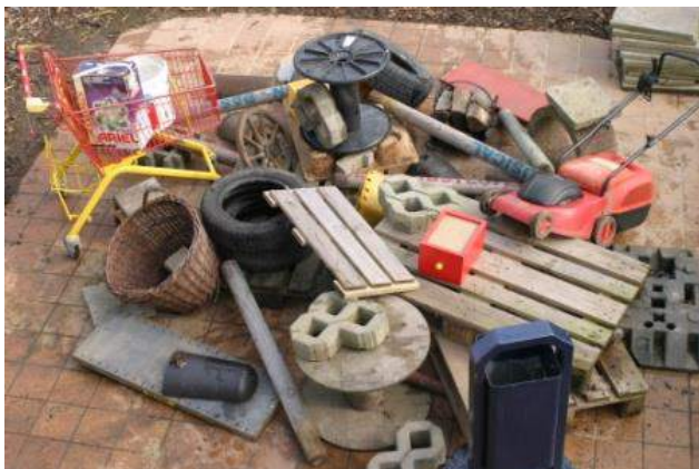
Aufbau eines Trümmerfeldes der LK 3